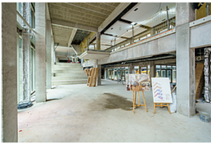
Hall d'accueil donnant rue des Gouverneurs