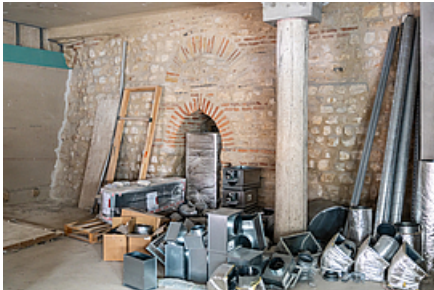
Erromatar garaiko horma bat mantendu da. Eraikinaren barnetik ikusrtzen ahalko da. © Théo Cheval